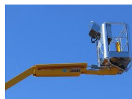
Fly jib (option)