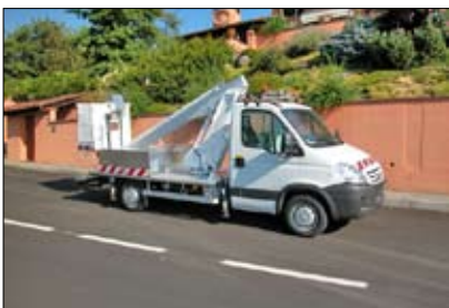
Multitel 145 ALU

ALU-serien har idag mellan 14,7 och 16,3 m arbetshöjd och är en enklare, mer prisvärd lift.