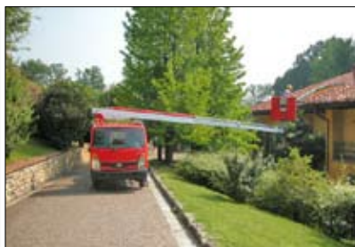
Multitel 160 ALU