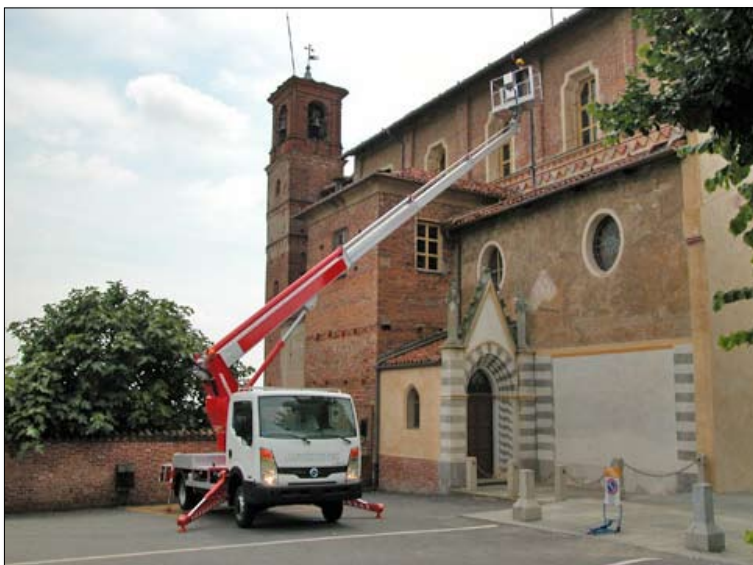
Multitel MT 222

Det finns idag modeller upp till 22 meter avsedda för montering på lätta lastbilar (upp till 3500 kg)