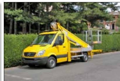
Multitel MT 222