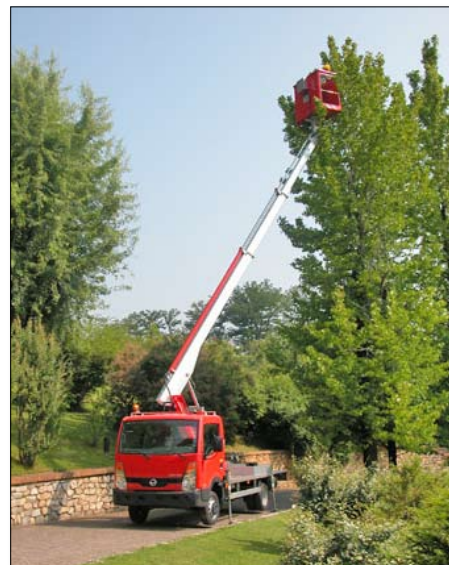
Multitel 160 ALU