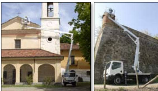
Multitel MX 225