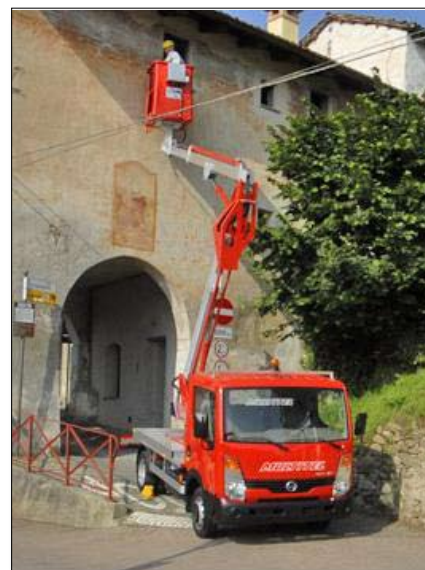
Multitel MX 130 (utan stödben)

Storsäljaren MX 200 med 20 m arbetshöjd är en smidig lift med bra prestanda.