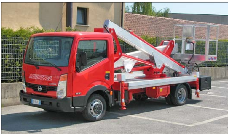
Multitel MX 170

Det finns idag modeller upp till 22,5 meter avsedda för montering på lätta lastbilar (upp till 3500 kg)