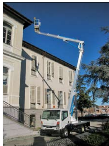
Multitel MX 200